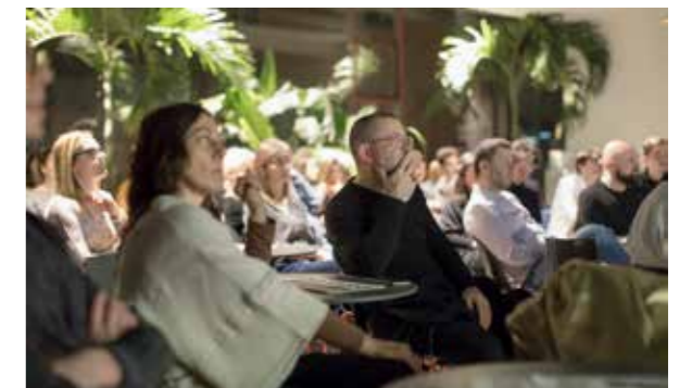
Občinstvo arhitekturnih dialogov